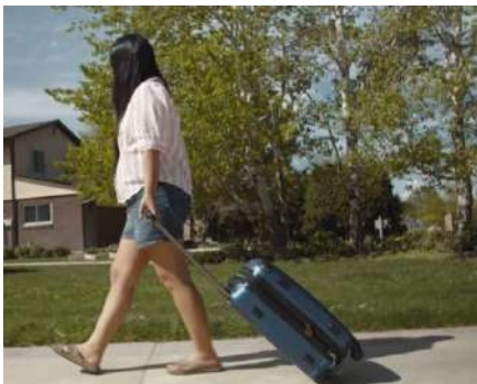
Huéspedes de Airbnb

Para usuarios temporales como personal de diferentes servicios, huéspedes, o repartidores, basta con otorgarles códigos temporales o Ekeys para habilitar el acceso programado. Funciona con o sin teléfono. Compartimos algunos ejemplos: