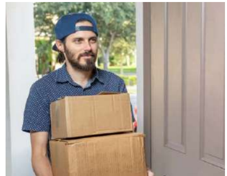
Repartidores, o contratistas

Limitado por día de la semana y hora. Se puede utilizar de forma recurrente dentro de los días y horarios establecidos.