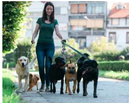
Niñeras, encargados de paseo de perros, personal de limpieza o mantenimiento

Acceso limitado por fecha y hora. Siempre se puede utilizar dentro del rango establecido y caduca automáticamente.